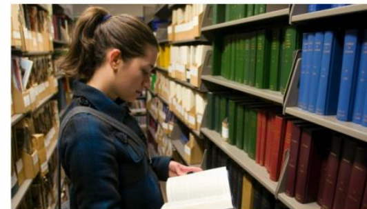
A student leafs through bound journals at a library at the University of Toronto. A new study shows that the five largest, for-profit academic publishers now publish 53 per cent of scientific papers in the natural and medical sciences – up from 20 per cent in 1973.

CBC News Posted: Jun 15, 2015 5:00 AM ET | Last Updated: Jun 16, 2015 9:23 AM ET